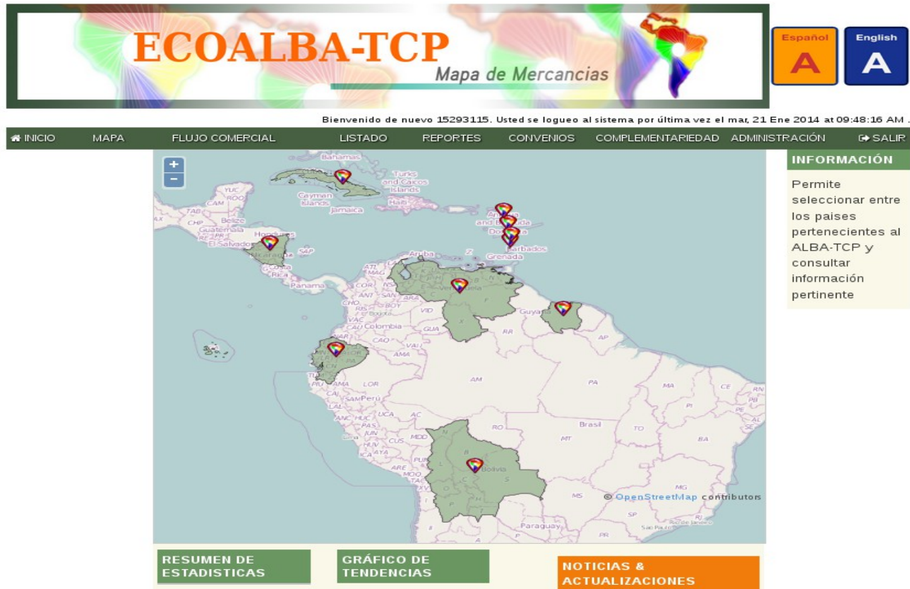
Figura 2. Módulo del Mapa ECOALBA-TCP.

B. Mapa de Visualización de Datos Básicos y Datos de Comercio Exterior de los países miembros del ECOALBA-TCP: Mediante el mapa el usuario puede consultar información básica del país seleccionado y así como también, consultar datos de Comercio Exterior de dicho país (pudiéndose consultar la información Intra-ALBA 17 y Extra-ALBA 18 ).