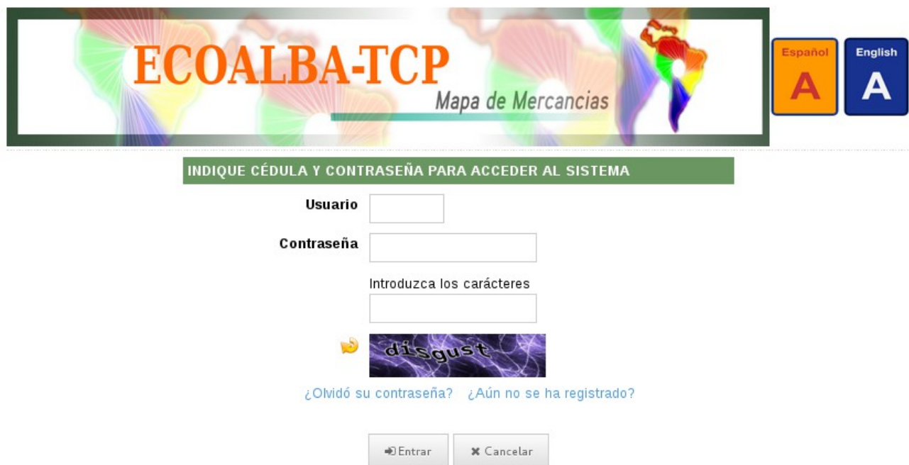
Figura 1. Módulo de usuarios y seguridad del Sistema ECOALBA-TCP.

A. Usuarios y seguridad: Módulo a través del cual el usuario puede gestionar su registro al sistema, modificar y consultar datos, crear su cuenta de usuario, cambiar y regenerar su contraseña. Por otro lado, el administrador de usuarios podrá activar y desactivar cuentas.